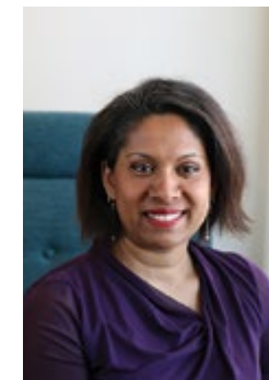
HÄLSNING FRÅN ORDFÖRANDE

Ungdomsåren är en utmanande tid för många. Framför allt för dem som av någon anledning inte möter de förväntningar som hela det finländska samhället ställer på de unga. Många mångkulturella unga ställs inför dessa förväntningar dagligen på grund av sin hudfärg, sitt språk, sitt namn, sina kläder eller sin härkomst.